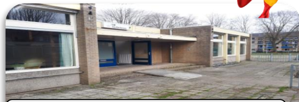
Activiteiten in de Hijskraan

Tijdens deze markt presenteren betrokken ondernemers uit de wijk e.o. hun diensten en producten aan elkaar en publiek. Iedereen is welkom van 13 tot 17 u bij de Hijskraan. Gratis toegang